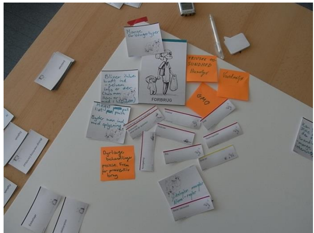
Figur 4 Interessent-analyse