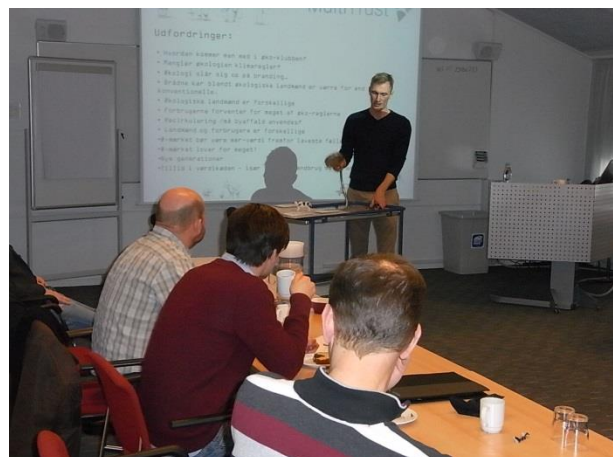
Figur 7 Præsentation af løsningsmodeller