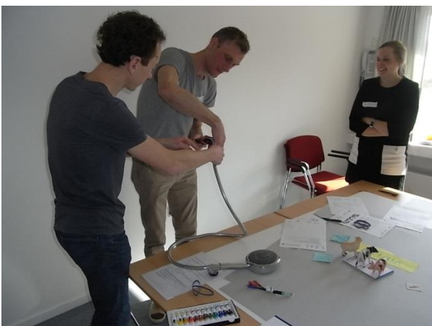
Figur 6 Arbejde med løsningsmodeller