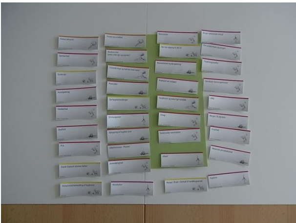
Figur 3 Udvalgte kriterier